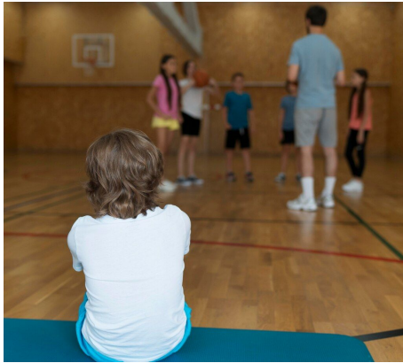
Tijdens de gymles