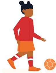
Liza 7 jaar