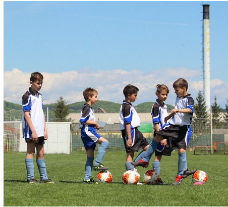
Bij de sportvereniging